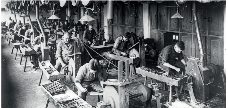
Der Puls der Klingengstadt: In den historischen Werkstätten wurde die Basis für den Weltruf gelegt.

Als mit dem Aufkommen von Schusswaffen die Ära der Ritterrüstungen und Schwerter endete, bewies Solingen Anpassungsfähig-